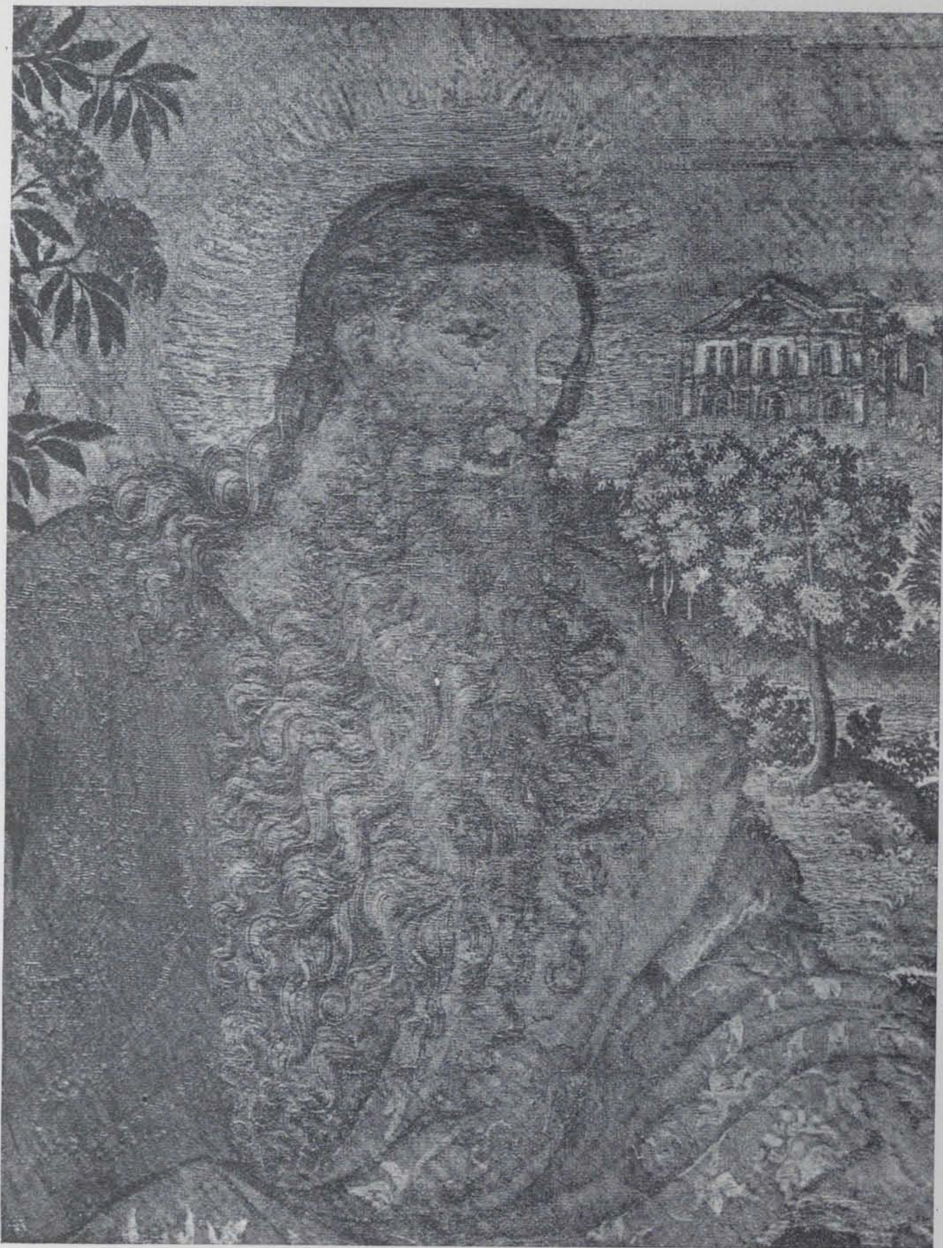
Fig. 677. — Detall del tapís que representa a Déu ordenant la construcció de l'arca