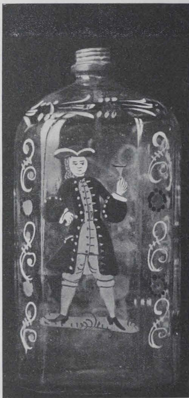
Fig. 686. — Ampolla esmaltada

No coneixem en la bibliografia de la vidrieria europea, cap estudi dedicat a aquestes modestíssimes obres, que en llur mateixa modèstia tenen la causa que els estudiosos no se n'hagin ocupat.