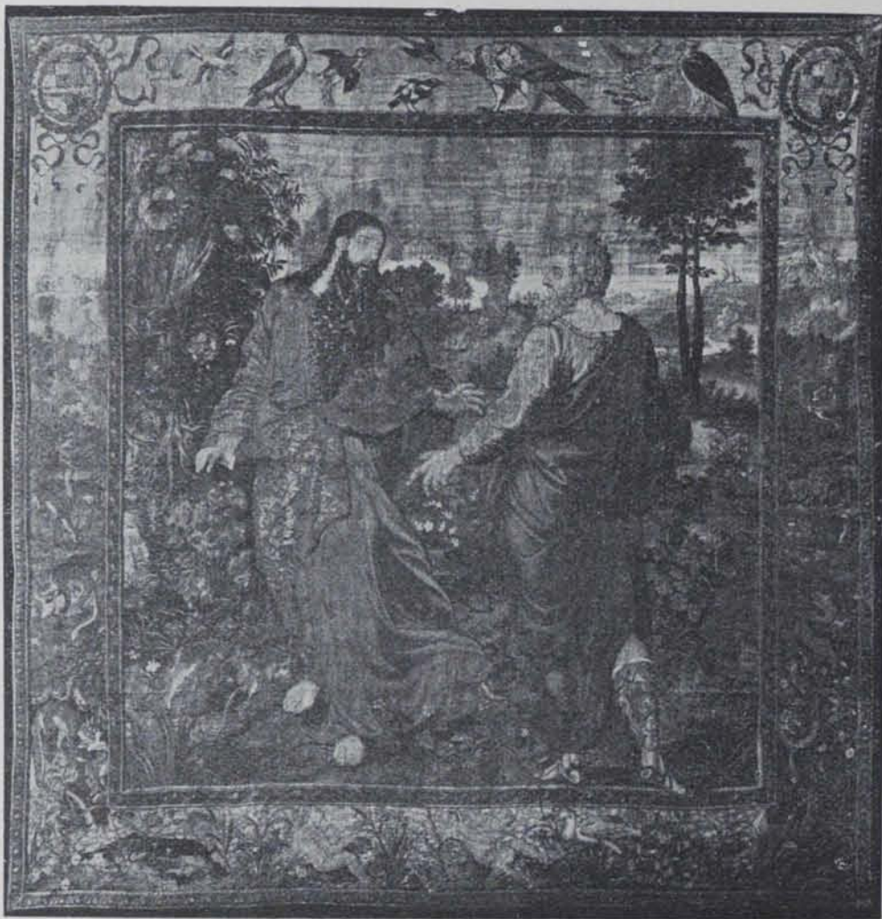
(Sèrie del Palau Reial)