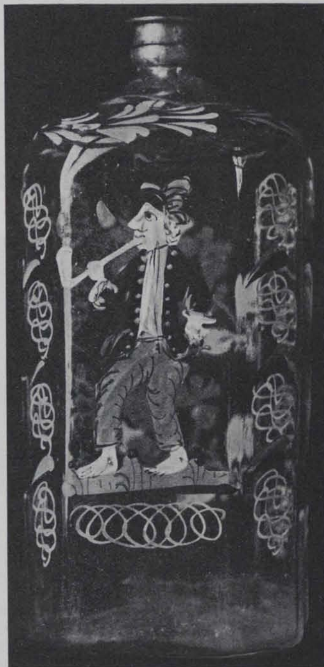
Fig. 687. — Ampolla esmaltada