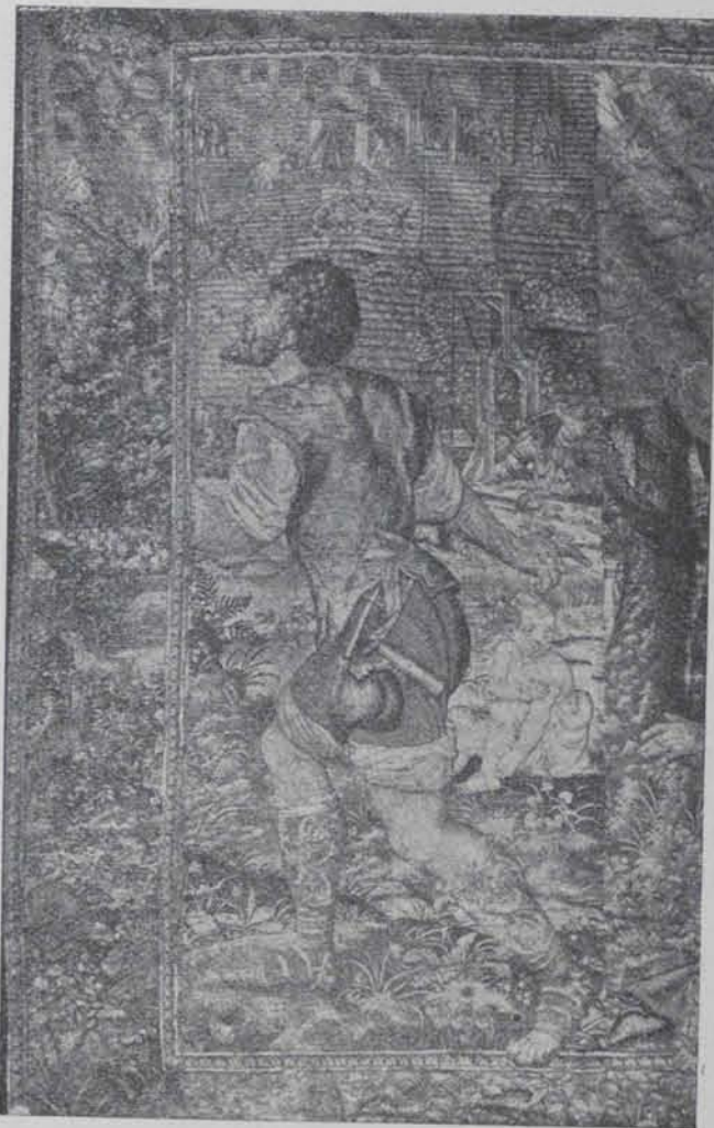
Fig. 683. — Construcció de la Torre de Babel

(Fragment d'un tapis del Palau de la Generalitat)