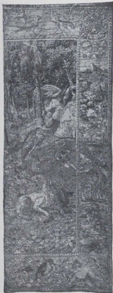
Fig. 681. — El Diluvi universal

(Fragments d'un tapís del Palau de la Generalitat)